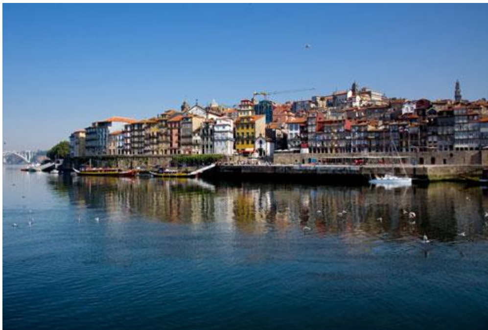
Foto: Douro-floden langs byen Porto