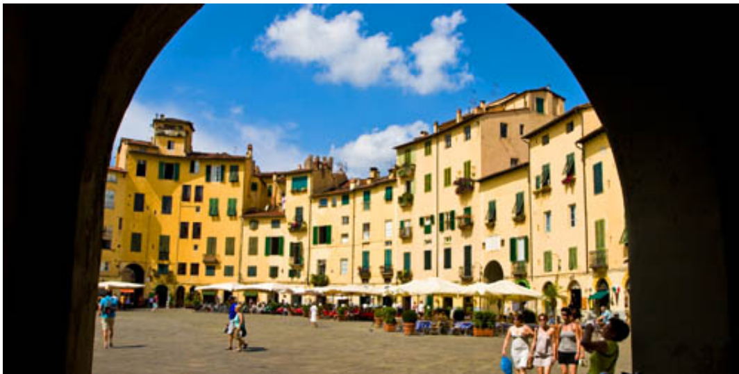
Billede: Charmende Lucca

smukkeste og mest velbevarede byer. Vi tager toget og møder vores lokalguide straks efter ankomsten, hvorefter vi får en inspirerende rundvisning i den gamle by, som er præget af de mange fine kirker og de hyggelige pladser. Der er mulighed for at spise frokost og kigge sig om på egen hånd, inden turen går tilbage midt på eftermiddagen.