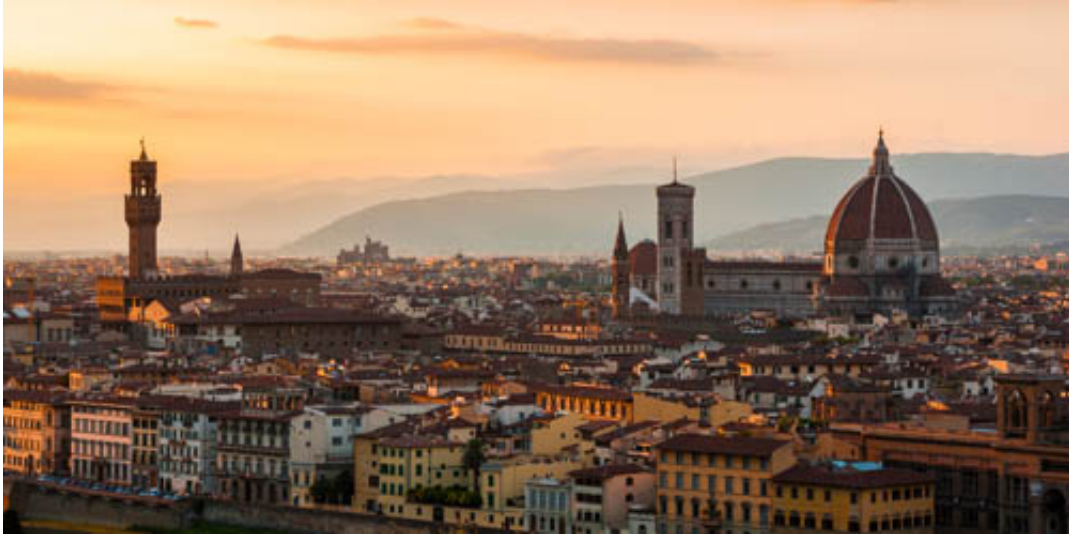
Billede: Firenze med Palazzo Vecchio og Duomoen.

I dag bliver der mulighed for at tage med til Toscanas smukke hovedstad Firenze, som er en af verdens førende kulturbyer.