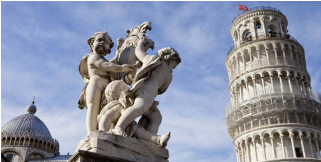
Billede: Det skæve tårn i Pisa.

Denne aften kommer vi sejlene til operaen, - en helt speciel oplevelse.